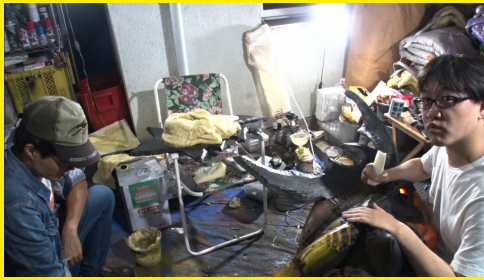
リビングや自分の部屋