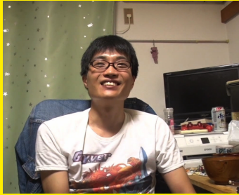
いつもの定位置やお気に入りの場所で