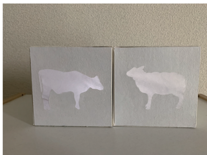
▲ 向かいあうと鳴き声が流れて光る