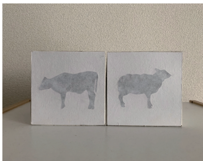
▲ 向かい合っていない時は何も起こらない