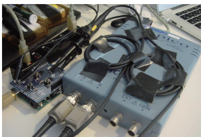
計測実験のために開発した専用ハードウェア