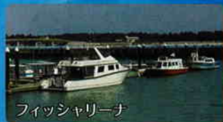
フィッシャリーナ