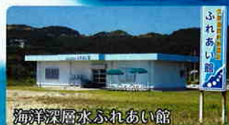
海洋深層水ふれあい館