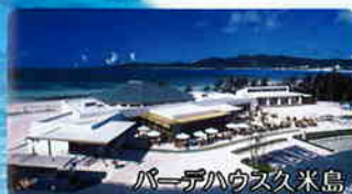
ビーチハウス久米島