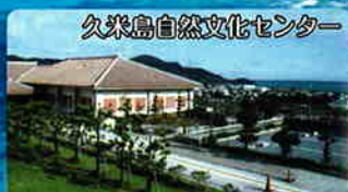
久米島自然文化センター