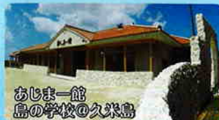
おしま一館 島の学校@久米島