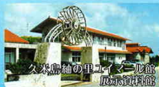
久米島綿の里ユイムール館 展示資料館