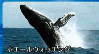
ホエールウォッチング