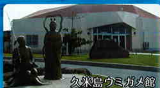
久米島ウミガム館